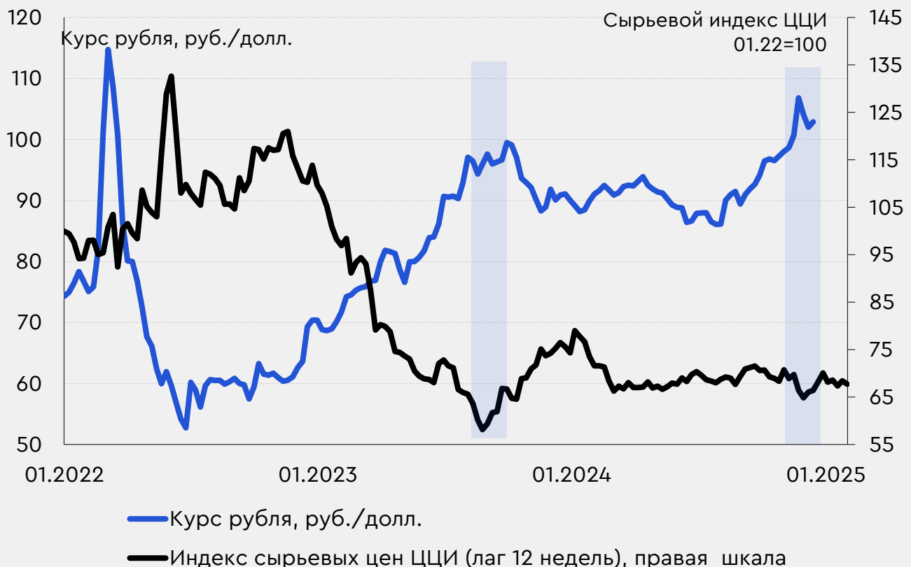
Рис. 2 Значения Сырьевого индекса ЦЦИ соответствуют уровням валютного курса в 95 руб./долл.